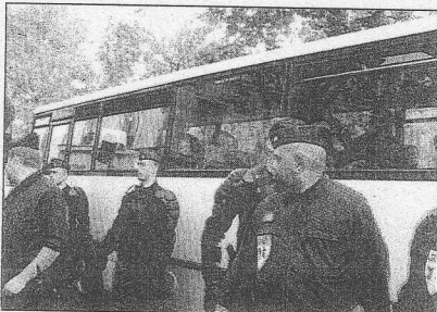
BOULEVARD VINCENT-AURIOL, HIER. Des dizaines de policiers ont évacué l'immeuble situé au numéro 150. 84 personnes ont été conduites dans des hôtels meublés de Paris et de banlieue. (L.P./B.H.)